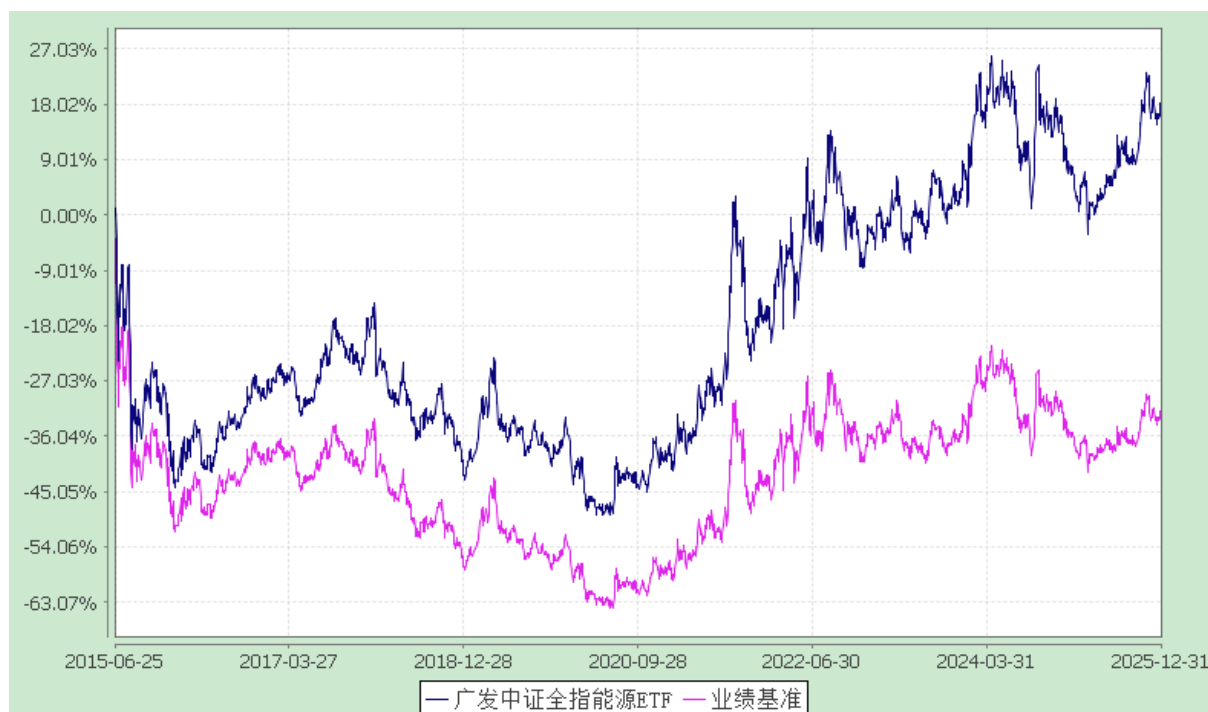
广发中证全指能源交易型开放式指数证券投资基金 份额累计净值增长率与业绩比较基准收益率的历史走势对比图 (2015年6月25日至2025年12月31日)