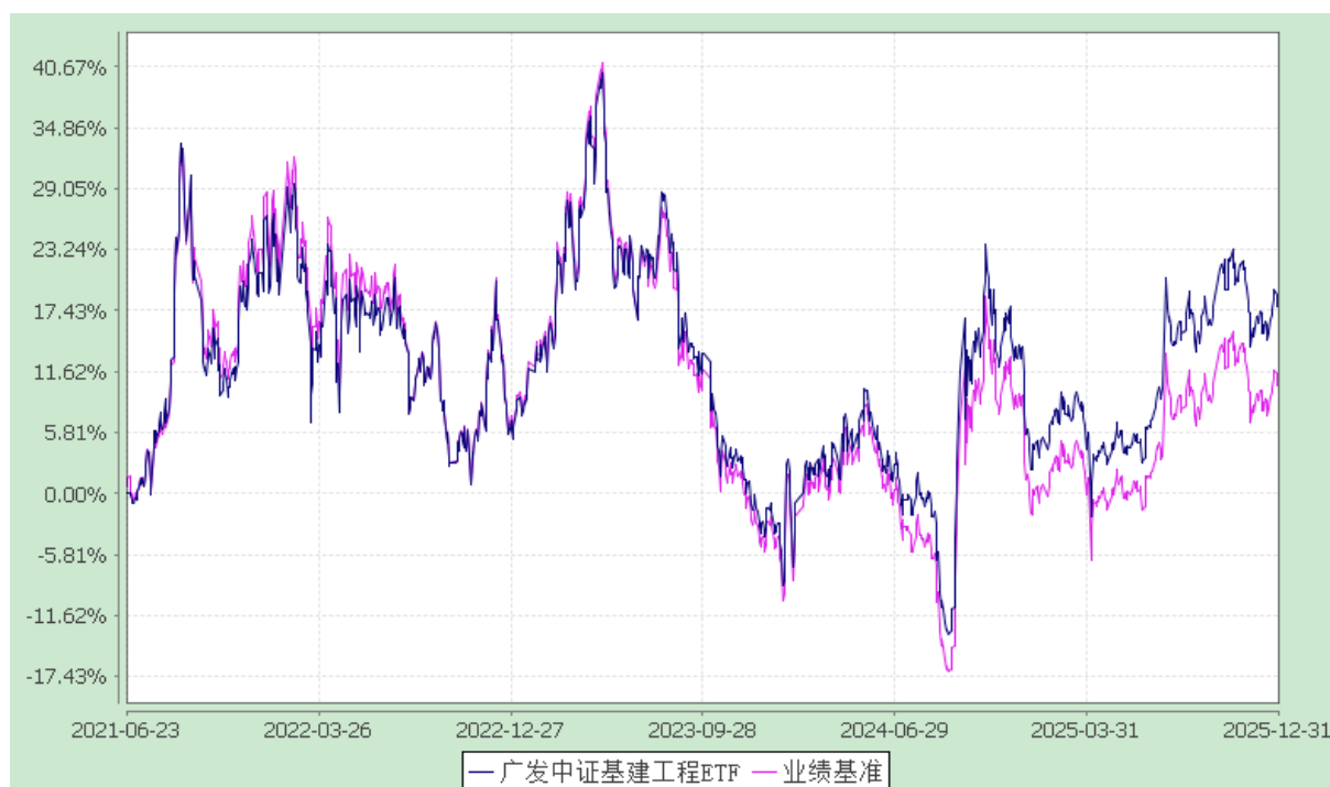
广发中证建设工程交易型开放式指数证券投资基金 份额累计净值增长率与业绩比较基准收益率的历史走势对比图 (2021年6月23日至2025年12月31日)